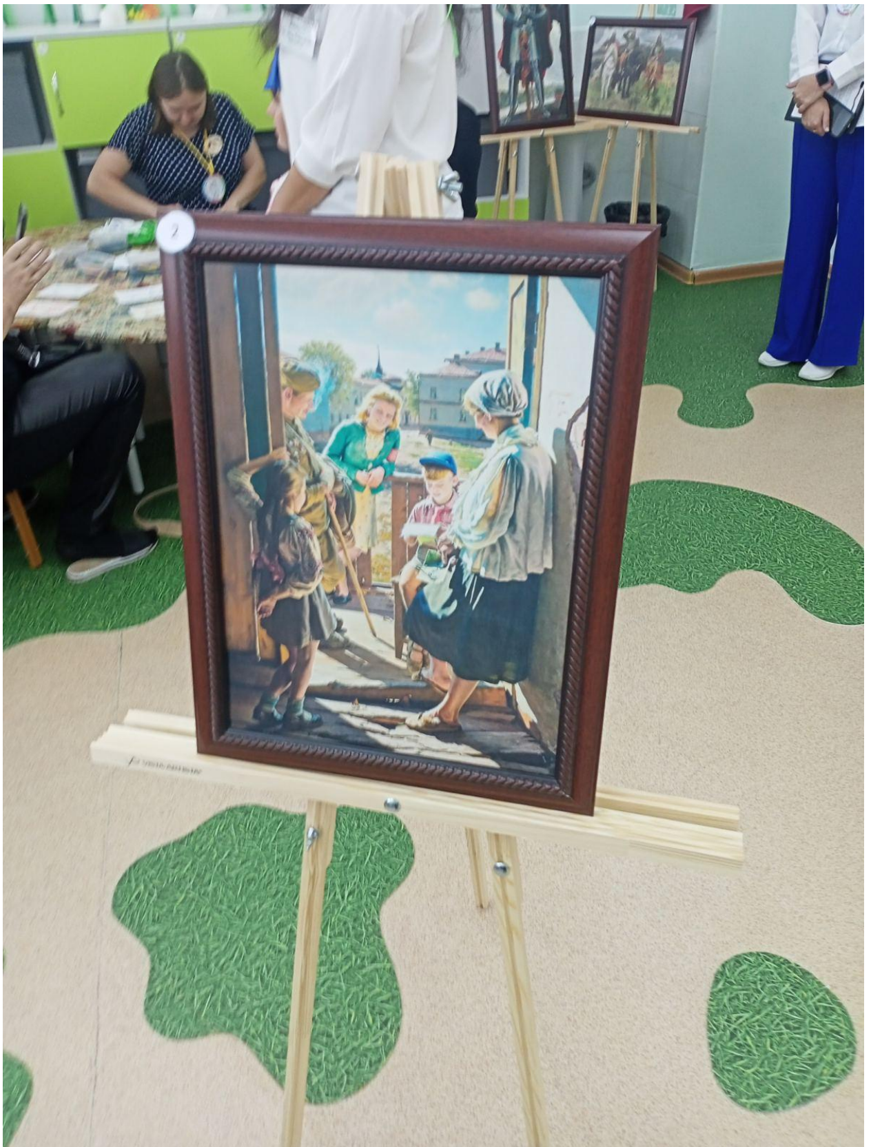
Описание картины, история написания.